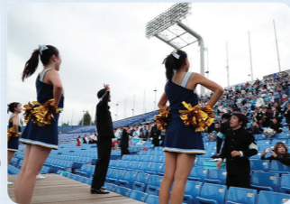
東京大学運動会応援部