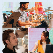
WAIWAI STEEL BAND

世界には様々な音楽があり、各国の文化と歴史が表現されています。トリニダード・トバゴ共和国にてドラム缶から作られた楽器スティールパンを使った演奏と西アフリカの伝統的なドラム、歌、ダンスによるアフリカン・パフォーマンスで会場を楽しく陽気な雰囲気に!